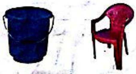
Fig-10: Articles made of plastics

ఎన చుట్టూ ఉన్న వస్తువులను చూడండి. ఎవరి దొంగడి. ఇతర గదులు, స్నానపు గదులలో ఎవరి వస్తువులను చూడండి. ఎవరం గదులలో కుర్చీలు? ఎవరు పంకేలించిన వివిధ రకాలైన వస్తువులను తయారు చేయడానికి ఉదాహరణగా ఎవరి యాధారం వియత్రి? తాలు, నూనెలను నిల్వ చేయడానికి ఉన్న ప్లాస్టిక్ సంచులు, ప్రాణాదులు మరియు బయటి భద్రపర్చుకోవడానికి ఎవరి వస్తువులను, నీటి నిల్వ కోసం ఎవరి బకెట్లు, కుర్చీలు, నీటిపంపులు, ఎన్నింటి ఉపకరణాలు కలెక్షన్, పేయింగ్ కంప్యూటర్ యరియు వస్తువులతో ఉన్న ప్లాస్టిక్ తయారు చేయబడతాయి. గయనించ వచ్చు... (ఎవరూ తగ్గిన ప్లాస్టిక్ వస్తువులను)