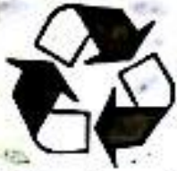
Fig-17: Universal recycling symbol

ಶಿಕ್ಷಣ ಕ್ರಮಗಳನ್ನು ಕೈಗೆತ್ತಿಕೊಳ್ಳುವುದು, ಅದರ ಮನವರಿಕೆ ಮಾಡುವುದು.