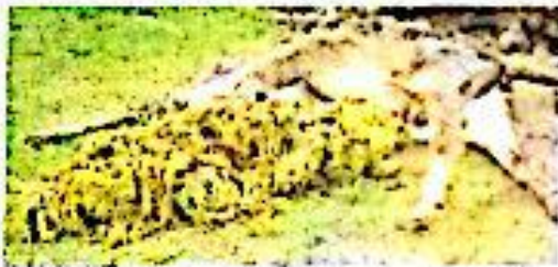
Fig-16: Plastic bags found in the stomach of a cow after a postmortem

ఎక్స్‌జెక్టివ్ నేతలు మా క్రాఫ్ ఆఫ్ దేవు మా ఎక్స్‌జెక్టివ్ ఆ క్రాఫ్ న పుష్టిం అవుతుంది అనుకు ఇది అధిగించుకు ప్రక చని అవుతుంది. అనుకు మాను