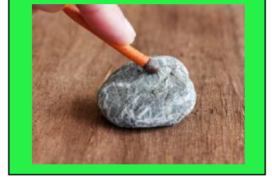
పటం - 10